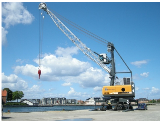
Liebherr LHM 120